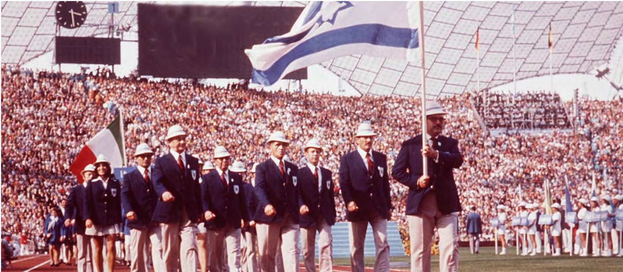
Einzug der israelischen Mannschaft ins Münchner Olympia-Stadion