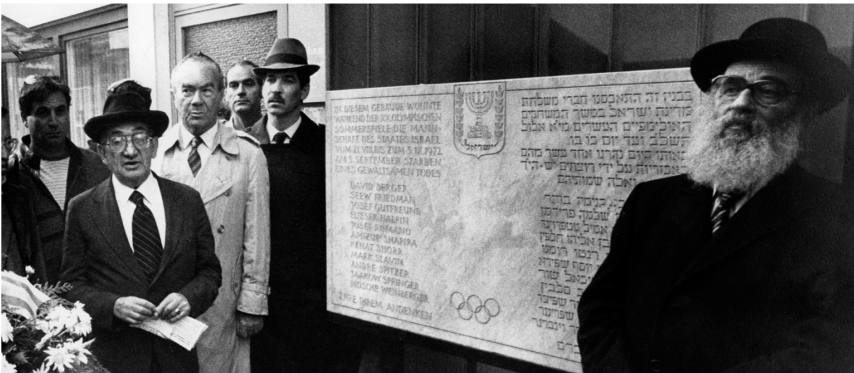
Einweihung der Gedenktafel in der Conollystraße 31 im Jahr 1972