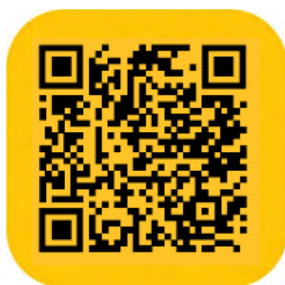
QR Code zur App